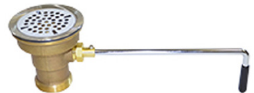
DrainKing™ Colador Plano